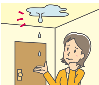
水濡れ損害による支払保険金の推移

冬季の凍結や老朽化などで水道管等に生じた事故による水濡れ損害の保険金の支払が増加しています。