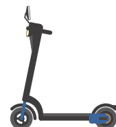
特定小型原動機付自転車のイメージ図