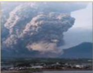
噴火による災害 有珠山噴火2000年