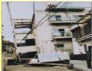
地震による倒壊 阪神・淡路大震災1995年

(注) 保険金額は、保険の対象が建物の場合5,000万円、家財の場合は1,000万円が限度となります。 (他契約がある場合や共同住宅の場合等、一部限度額が異なる場合があります。)