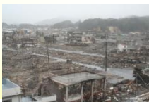
津波による災害 東日本大震災2011年